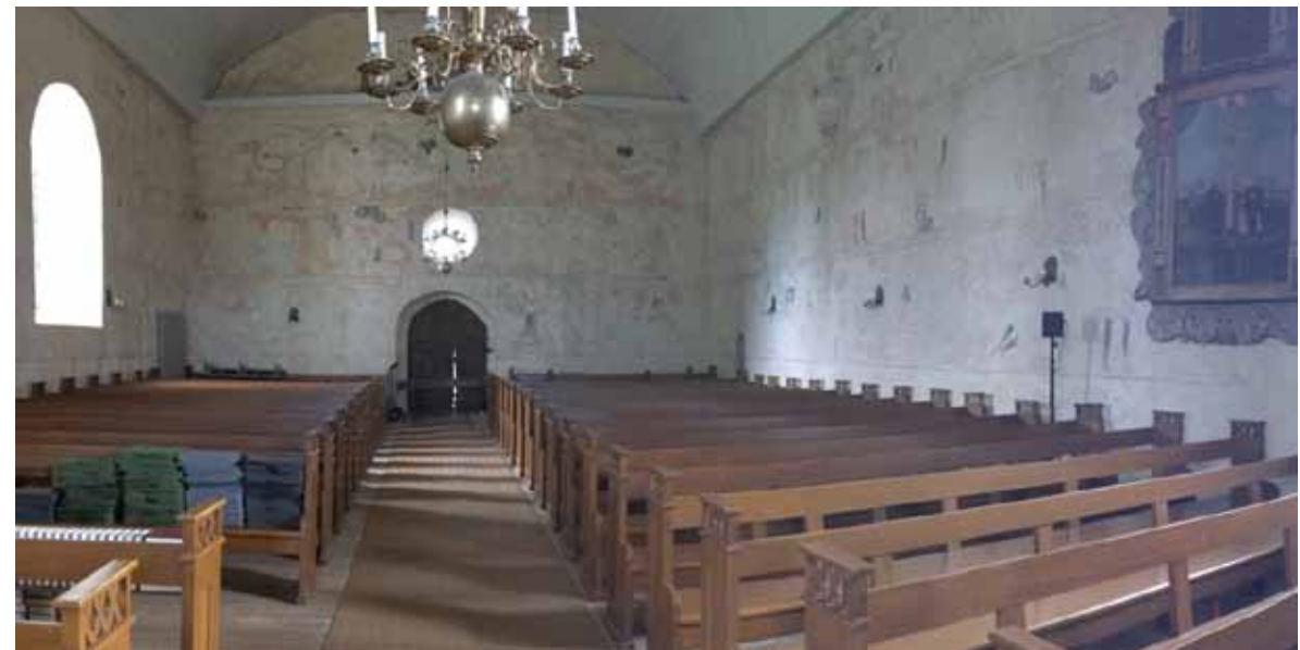
Markkinat ovat vanhan kirkon kupeessa. Sunnuntaina kirkossa pidetään jumalanpalvelus 1700-luvun tyyliin.